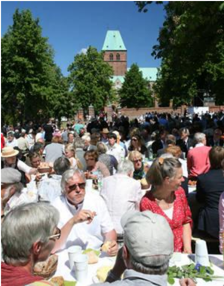
Gründungsfest in Ratzeburg

Jetzt sind wir Nordkirche – seit Pfingsten. Was bedeutet das? Erst einmal nichts? Die Kirchgemeinde Gehlsdorf bleibt bestehen. Es wird in unserer Gemeinde so weitergehen wie bisher. Das es diesen großen Zusammenschluss gegeben hat, wird kaum zu spüren sein. Es ist die Zusage aus der Kirchenleitung, dass die derzeitigen Personalstellen mittelfristig bestehen bleiben. Was so selbstverständlich klingt, ist allerdings eine große Veränderung. Denn die letzten 15 Jahre waren geprägt von Personalabbau und Gemeindegemeinschaften, um mit den vorhandenen finanziellen Mitteln auszukommen. Und die sind im